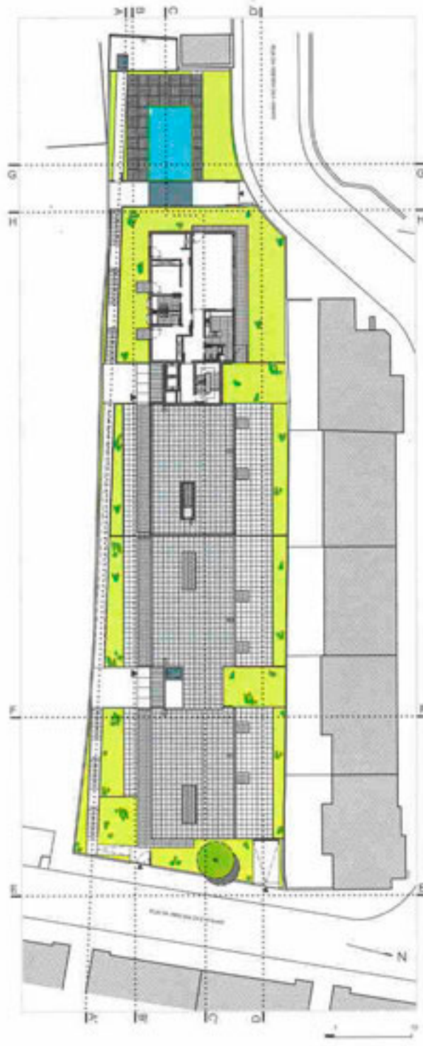
PLANTA COBERTURA PLANTA CUBIERTA 01