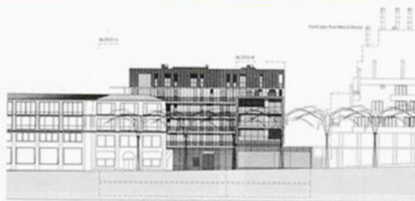
Alçado Noroeste - Bloco A e B